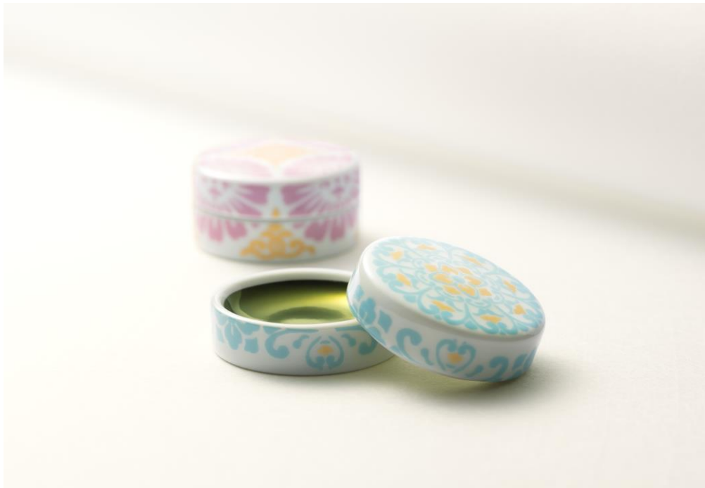
小町紅 凧(手前)、小町紅 華(奥)

凧とした神職のまとう絹衣のような爽やかな色合いの器に、日本伝統の化粧料・小町紅を刷いた逸品です。